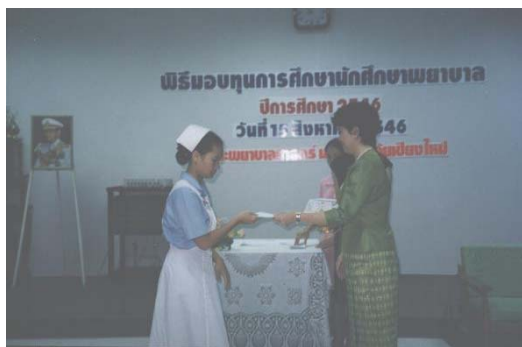
โครงการพิธีมอบทุนการศึกษานักศึกษาพยาบาล