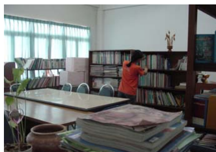
ห้องอ่านหนังสือชั้น 4