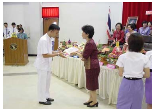
โครงการรักษาศูนย์