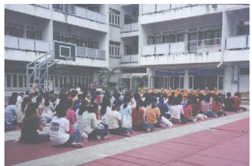
โครงการหอพักน้าอยู่