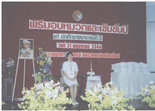
พิธีมอบหมวกและเข็มชั้นปีนักศึกษาปีที่ 3