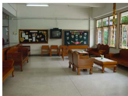
มุมโทรทัศน์รายการปกติ(ห้องโถง)