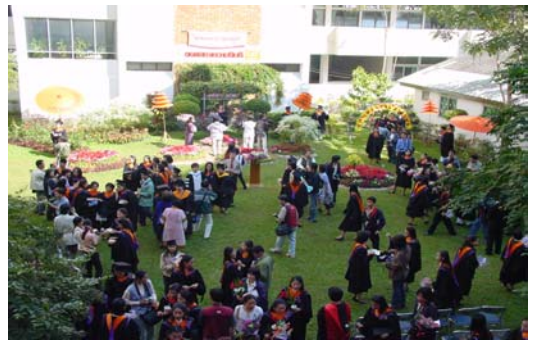
โครงการแสดงความยินดีกับบัณฑิต