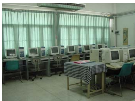
ห้องคอมพิวเตอร์ชั้น 1