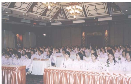
สัมมนานักศึกษาพยาบาลชั้นปีที่ 1