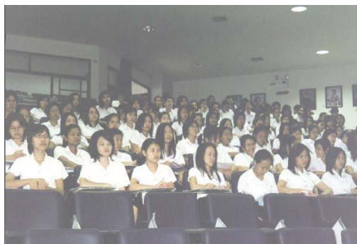
ปฐมนิเทศนักศึกษาหอพัก