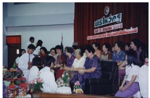
พิธีไหว้ครูประจำปีการศึกษา 2546