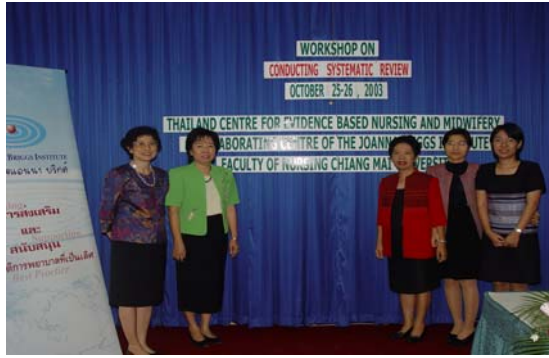
โครงการอบรมเชิงปฏิบัติการ เรื่อง การทบทวนวรรณกรรม อย่างเป็นระบบ ระหว่างวันที่ 25-26 ตุลาคม 2546 ณ ห้องประชุมเปริียบ ฯ